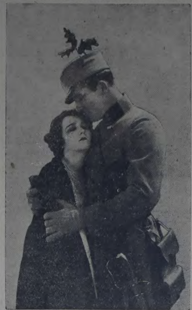
MARY PHILBIN Y NORMAN KERRY, PROTAGONISTAS DE "AMAME Y EL MUNDO ES MÍO", PELICULA "JEWEL ESPECIAL" QUE EL 19 HARÁ ESTRENO EN LA "UNIVERSAL PICTURES CORPORATION DE ARGENTINA".