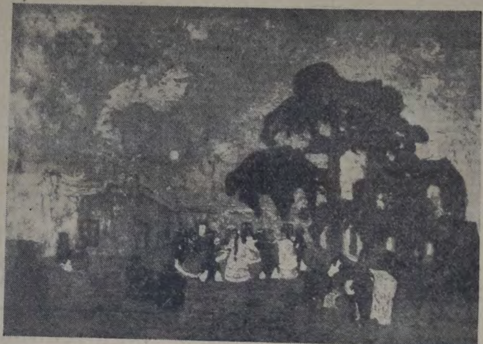
"FIESTA EN LA ESTANCIA", otro cuadro de Figari.

Los grises y los blancos de Figari, poemas, gotas de rocío, suavidades de perla.