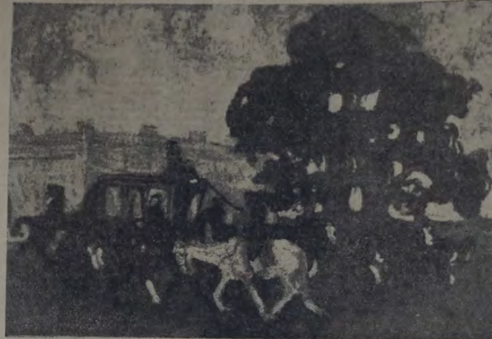
LA DILIGENCIA, cuadro de Pedro Figari

Lo somático se define en bellas sinfonías de color, en acordes de tonos claros, en armonías de blancos, de azules, de grises, de rosas, de negros.